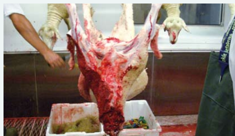
Forurenset under slakting