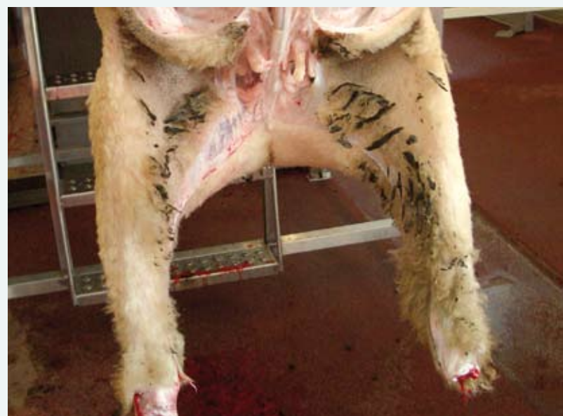
Slakt som er for dårlig klipt på kritiske områder