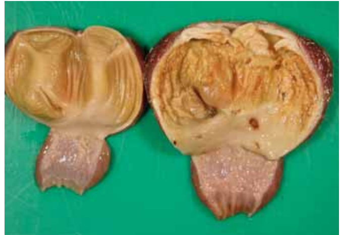
Normal krås (t.v.). Krås med sår og betennelse (t.h.)

Dette er et viktig spørsmål som fortsatt er ubesvart. Vi har likevel fått noen foreløpige svar som indikerer at vi kan utelukke noen vitaminer, mineraler, mykotoksiner, virus og bakterier som sentrale faktorer i årsaks-komplekset. Det er imidlertid mye analysearbeid som gjenstår, og vi arbeider med å samle inn materiale fra de resterende flokkene for få oversikt over omfang og forløp av denne lidelsen hos slaktefjørfe i Norge.