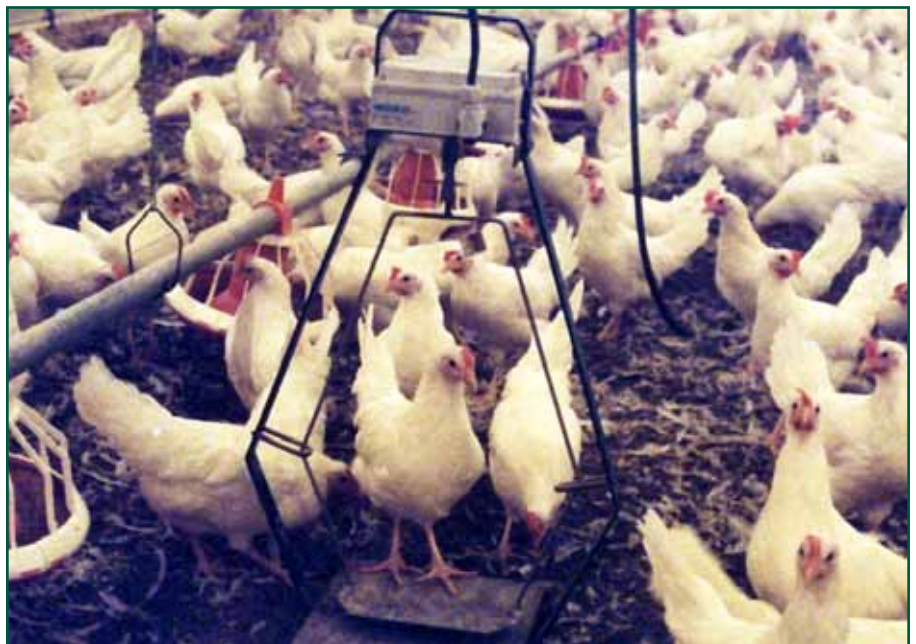
Automatisk veiing av unghøner.