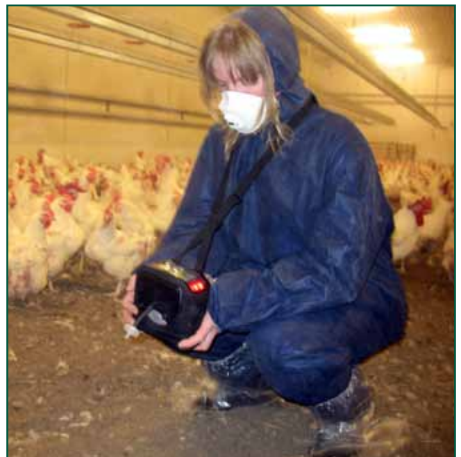
Måling av ammoniakk.

2 Forutsatt at målinger ikke utføres i tilknytning til lyspåsetting, fôring, strøbearbeiding, flokkuro, e.l.