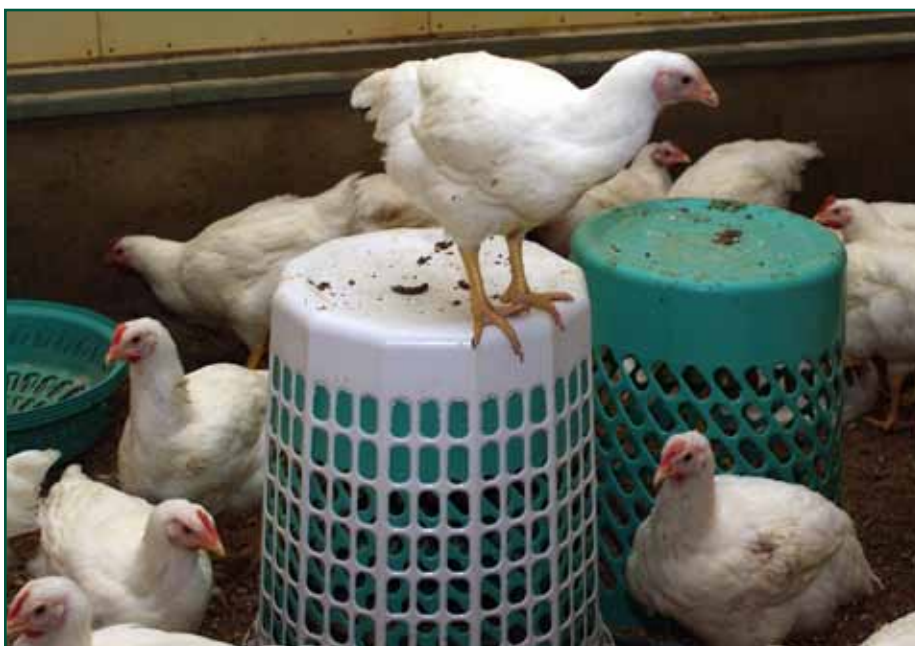
Innredning i oppalshus.