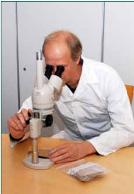
Undersøkelse av felle for midd.

Redusere antall middpositive konsumeggflokker