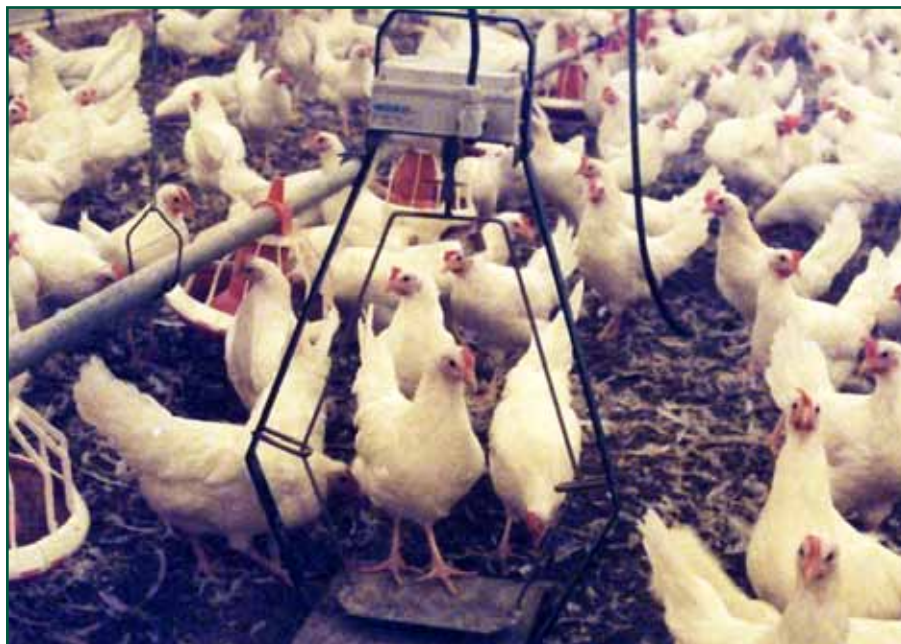
Automatisk veiing av unghøner.