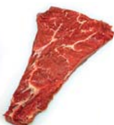
Flat iron filet

blitt tatt ut. Alle produktene unntatt dragebiff kommer fra skrottens forpart, og er førsteklases råvarer.