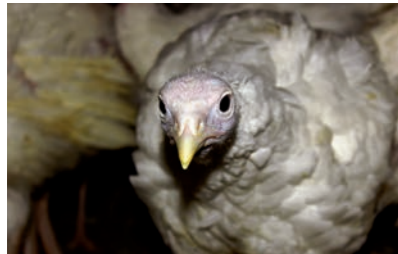
Dyrevelferdsprogram kalkun skal sørge for at velferden til den enkelte kalkun er ivarett.

Dyrevelferdsprogram kalkun ble iverksatt 1. januar 2017 og er obligatorisk for alle som har mer enn 200 kalkuner for kjøttproduksjon. Programmet er forskriftsfestet i Forskrift for hold av høns og kalkun. Programmet inkluderer krav om daglig registrering av produksjonsdata og velferdsregistreringer på gården, som antall dyr innsatt, daglig dødelighet, årsaker til dødelighet, luftkvalitet og andre hendelser knyttet til dyrehelse og dyrevelferd. I tillegg kommer registreringer knyttet til plukking og transport og alle slakteriregistreringer. Alle flokker blir bedømt for tråputer, og tråputeskader over definerte nivåer gjør at bonden får lavere tetthet i påfølgende innsett. Alle kalkunbønder skal ha minst to årlige helseovervåkningsbesøk av veterinær og ekstern KSL-revisjon minst hvert tredje år.