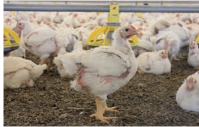
Dyrevelferd handler om enkeltindivid, og dyrevelferdsprogram slaktekylling inneholder krav om registrering av dyrebaserte velferdsindikatorer på individnivå.