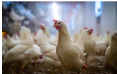
Dyrevelferdsprogram verpehøns innføres fra 2020 og inkluderer obligatoriske registreringer av miljø- og dyrebaserte velferdsindikatorer.

Dyrevelferdsprogram verpehøns blir iverksatt 1. januar 2020 og vil være obligatorisk for alle som har 1000 verpehøns eller mer. Programmet vil bli forskriftsfestet i Forskrift for hold av høns og kalkun. Programmet inkluderer krav om registrering av produksjonsdata og velferdsregistreringer på gården, som antall dyr innsatt, daglig dødelighet, dødelighetsårsaker, luftkvalitet og andre hendelser knyttet til dyrehelse og dyrevelferd. Kun et fåtall av norske verpehøner sendes til slakt. De fleste blir avlivet på gården. Alle eggbønder skal derfor delta på kompetansekurs i avlving av verpehøns. I tillegg skal alle eggbønder ha minst ett årlig helseovervåkningsbesøk og ekstern KSL-revisjon minst hvert tredje år. For å sikre oppslutning om programmet, skal eggpakkeriet beholde 10 øre/kg egg gjennom innsett. Det vil tilbakebetales når produksjonsdata er registrert og helseovervåkningsbesøket er gjennomført.