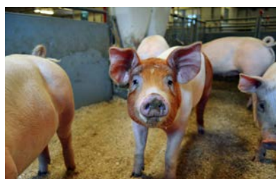
Dyrevelferdsprogrammet for svin omfatter alle besetningstyper.

Regelmessige veterinærbesøk er en sentral del av programmet, hvor dyrevelferd og rutiner står i fokus. Det er inntil tre årlige besøk avhengig av hvor mange griser besetningen slakter per år. Ved disse besøkene skal veterinæren og produsenten sammen gå gjennom besetningen og se på dyra og rutinene. Enkelte punkter skal alltid gjennomgås og dokumenteres, inkludert oppfølging av sjuke og skadde dyr, rutiner for bruk av sjukebinge og korrekt avlving, bruk av strø- og rotmateriale,