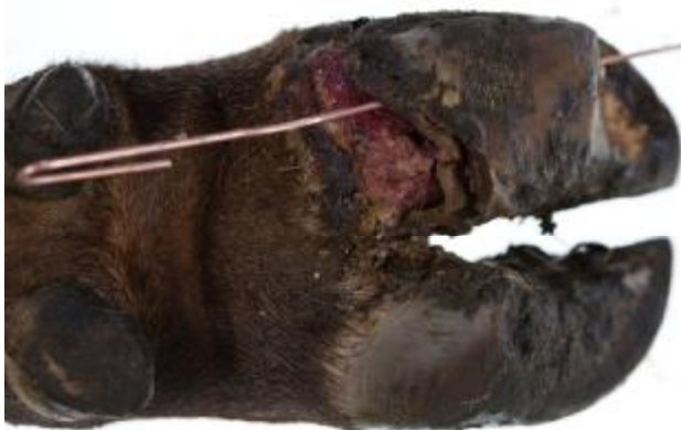
Bilde til høyre: Høyrebeinet til kvige nr. 2 var hovent opp til koden med underminert såle. Legg merke til de korte klauvene.

Undersøkelse av dyr i forbindelse med kjøp og salg bør inkludere en nøye utfylt helseattest. Det bør foreligge dokumentasjon fra Helsekort klauv på alle enkelt dyr og også på hele besetningen. Det er viktig å være oppmerksom på at dyr med korte klauver kan bli sårbeinte og få alvorlige infeksjoner. Det kan derfor være nødvendig å sette slike dyr på underlag som ikke gir slitasje en stund (i noen tilfeller så lenge som to uker). Beiteslipp av dyr med korte klauver kan enten på grunn av slitasje eller for hard klauvskjæring være risikabelt selv om det, som i dette tilfellet, ikke er noe ved beitet som skulle tilsi at man burde forutse for stor slitasje.