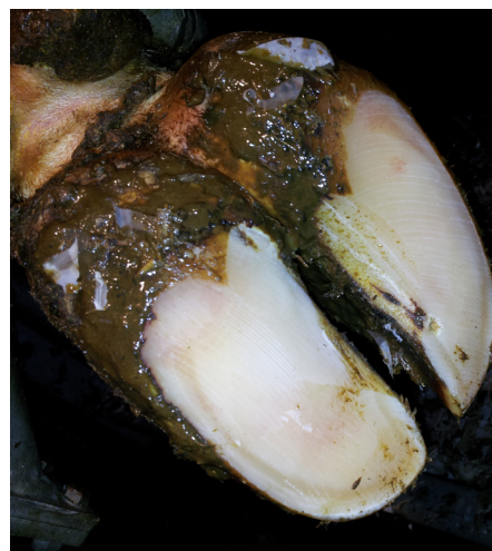
Ferdig beskåret klauv.

Eg er fra Hallingdal, men har hovedbase i Lom. Eg er gift og har to gutter på 8 og 12 år. Eg driver som klauvskjærer på heiltid og har kvk hydraulisk boks 650-2, som eg er veldig godt fornøgd med. Eg venter ny KVK-boks i løpet av våren: den aller siste modell 2013. Eg har også investert i grindesystem som letter arbeidet veldig mye. Av transport har eg lastebil man c-180 inntil 7500 kg, skapbil med varme og det er godt om vinteren. Syns eg har ein fantastisk arbeidsplass og får se mye av vakre Norge og treffer mange flinke gardbrukere rundt omkring. Ellers er min store lidenskap musikk og spesielt gammaldans. I disse dager kjem eg ut med ny cd og det hender eg spelar for kuene og bonden, da blir det fest på fjøset!