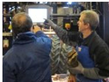
Fra workshop i Danmark

Danskene er imponert over at så mange klauvskjærere rapporterer i papirform. Vi regner med å få inn ca 75-80 000 innrapporteringer i 2012. Det betyr at det finnes minst 3 ganger så mange klauvhelseregistreringer ute på gårdene (i følge undersøkelser blant sertifiserte klauvskjærere). Veldig bra! Dette er opplysninger vi ville fått inn om klauvskjærere hadde rapportert direkte. Håpet er at dette kan bli en realitet i løpet av 2013/14. Men inntil videre må vi stå på for å få inn flest