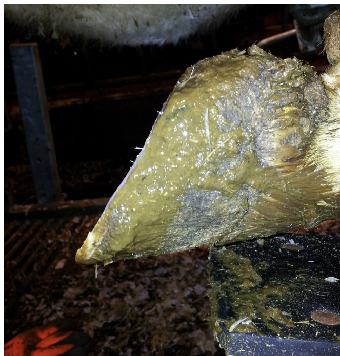
Klauv beskåret av Øystein Nicolaisen

portert! Det er derfor viktig at dere står på og holder dette varmt inntil vi får en bedre ordning med innrapportering direkte fra klauvskjærer via håndholdte terminaler. I løpet av våren vil det kjøpes inn 3-4 terminaler for testing. Når det gjelder fordelingen av de ulike klauvlidelsene, så er den omtrent den samme som tidligere med flest korke-trekkere (10.2 %), dernest V-format hornforråtnelse (5.4 %), løsnings i den hvite linjen (4 %), såleknusning, blødning og hudbetennelse (begge 2 %). 73 % av «diagnosene» var normal.