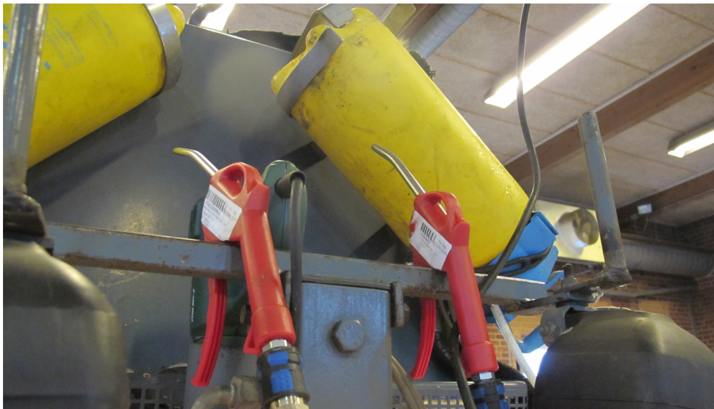
Til reingjøring av klauver før beskjæring