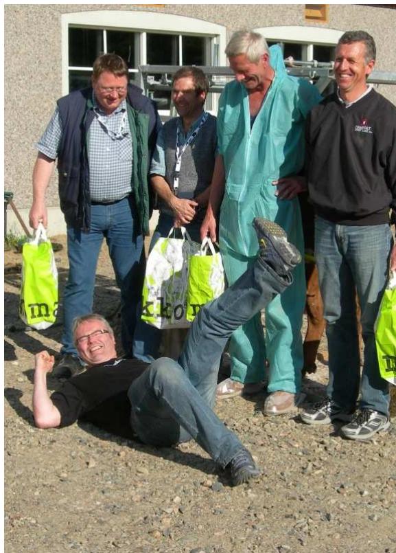
Bildet over: Her ser du foreleserne på Nordisk klauvskjærertreff 2008 i Iisalmi i Finland. Ikke noe i veien med humøret!