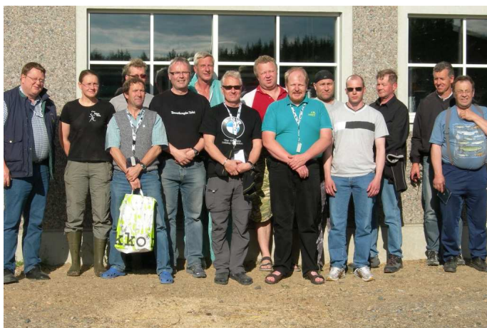
Over: alle deltagerne på Nordisk klauvskjærertreff 2008 i Finland.

Til venstre: beskæring med rå mannekraft! Underholdende, men kanskje ikke noe for nybegynnere?